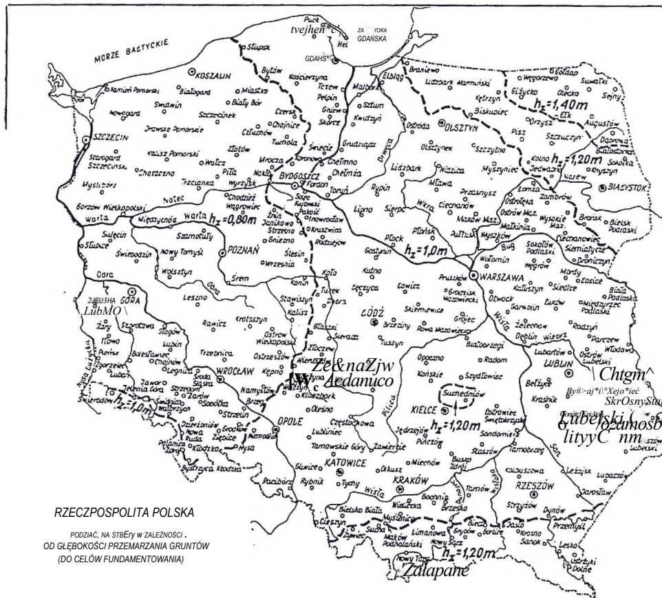
Rys. 1. Podział kraju na strefy w zależności od głębokości przemarzania gruntu (wg PN-81/B-03020)

5.3.6 Przewody sieci kanalizacyjnej na mostach, jeśli nie służą do odwodnienia jezdni i chodników, powinny być umieszczone w stalowych rurach ochronnych, zgodnie z wymogami rozporządzenia [4],